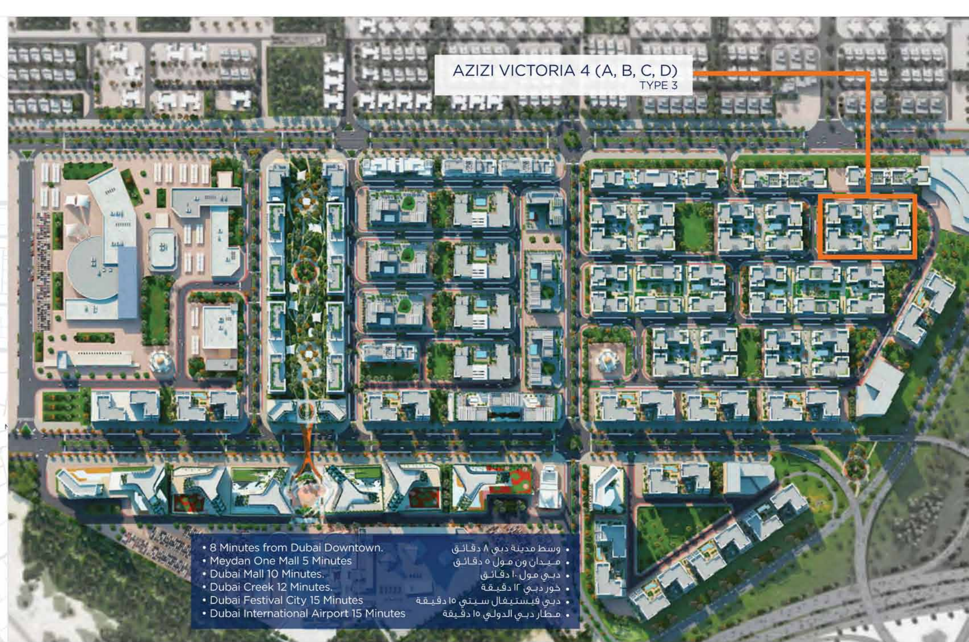
AZIZI VICTORIA 4 (A, B, C, D) TYPE 3